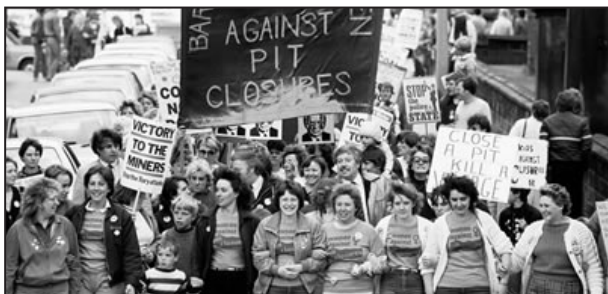
Kvinner mot Thatcher

Regjeringen sa at mange gruver skulle stenges og framprovoserte streiken som varte i ett helt år. De hadde planlagt den nøye og brukte enorme ressurser for å sikre seieren. Gruveområder ble okkupert av politiet og tusener ble arrestert. Mange av disse småbyene er øde i dag. Der det finnes folk, var det feiring med bål og dans etter Thatchers død.