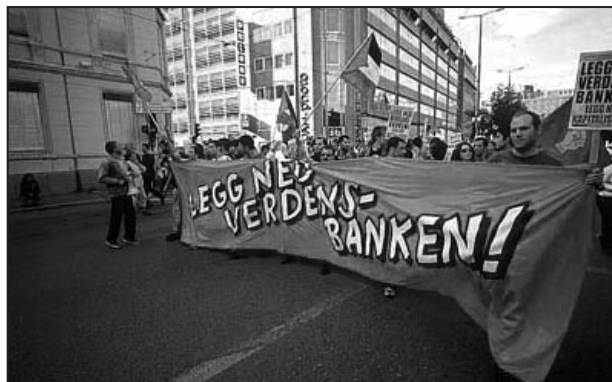
Verdensbank-demonstrasjonen i 2002.

Under kriser er det vanlige folk som blir angrepet, og det er vanlige folk som blir kriminalisert. I løpet av de siste fire årene har vi sett millioner bli dumpet ned i arbeidsledighet og fattigdom. Hele generasjoner har blitt spyttet ut av en kapitalistisk